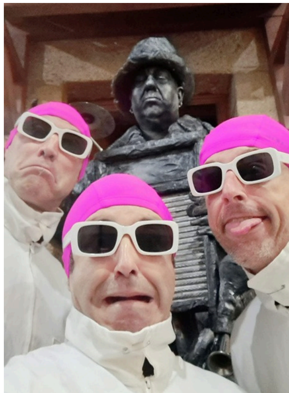
TEATRO DE RUA