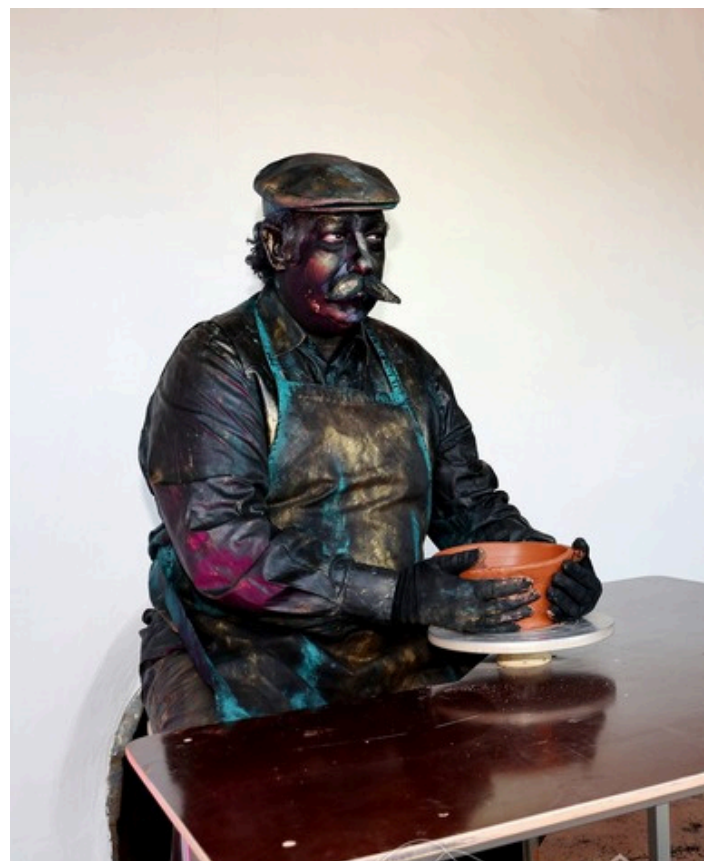
FESTIVAIS DE ESTÁTUAS